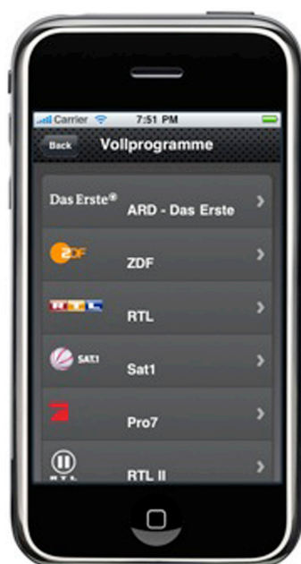
Abbildung 1: Fernsehprogramm auf dem iPhone

EPG Mit EPG hat SYRACOM unter anderem eine prototypische App entwickelt, die auf eine zentrale Fachlogik zugreift und dank moderner Web-Technologien auf einer Vielzahl von mobilen Plattformen funktionsfähig ist. (Ein weiteres Whitepaper zu EPG als native App für Android steht auf unserer Webseite zum Download bereit.)