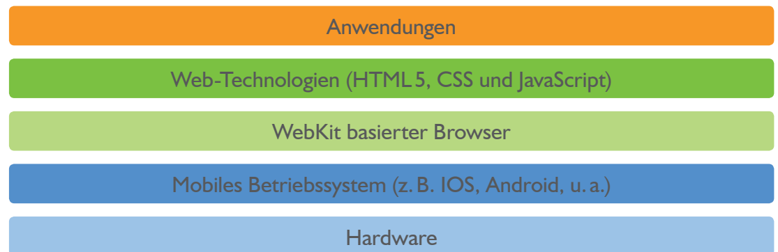
Abbildung 2: Architektur der App

Entsprechend der Zielplattform Browser besteht die App somit aus bekannten Web-Technologien, wie HTML und JavaScript. Um das Look'n'Feel typischer mobiler Endgeräte mit Gestensteuerung zu erreichen, kommen zudem spezielle JavaScript Bibliotheken zum Einsatz, wie jqTouch.